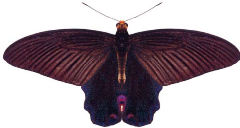
属 Papilio 種小名 elephenor 英名 和名 オナシカラスアゲハ 分布 アッサム 開長 118mm