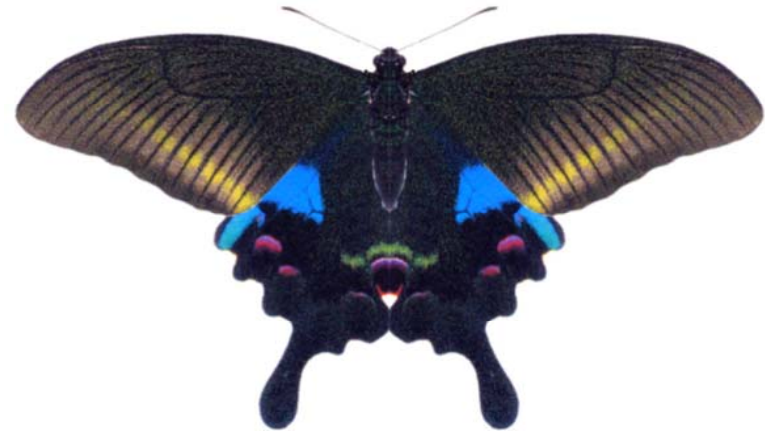
属 Papilio 種小名 arcaturus 英名 Blue Peacock 和名 オオクジャクアゲハ 分布 Himalayas～中国南部の高地 開長 130mm 食草 ミカン科のフユザンショウなど。